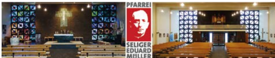
St. Josef, Trappenkamp, Sudetenplatz 15 (TRA)