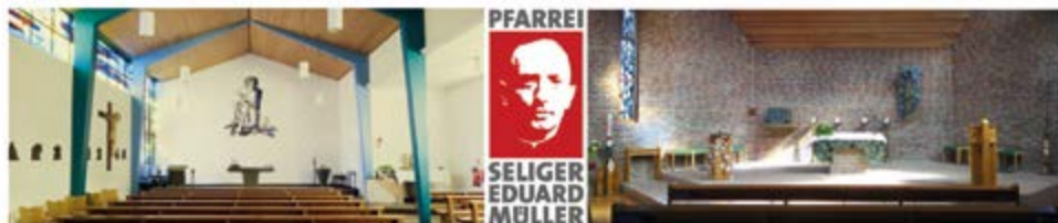
Jesus Guter Hirt, Bad Bramstedt, Sommerland 3 (BB)