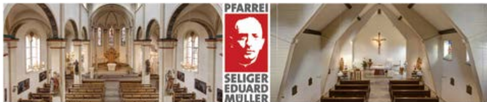
St. Maria-St. Vicelin, Neumünster, Bahnhofstr. 35 (NMS)